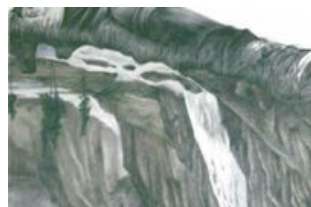
GRAPHIC dessin contemporain 15 mars - 26 avril 2013 PHAKT - Centre Culturel Colombier http://www.phakt.fr