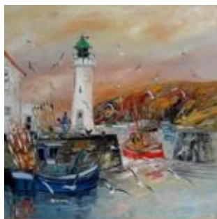
SANSEAU mars - avril 2013 La Galerie du Parlement, RENNES www.galerieduparlement.com