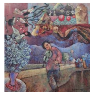
GOTKOVSKY 1er mars - 7 avril 2013 Galerie LAUTE, RENNES www.galerielaute.com